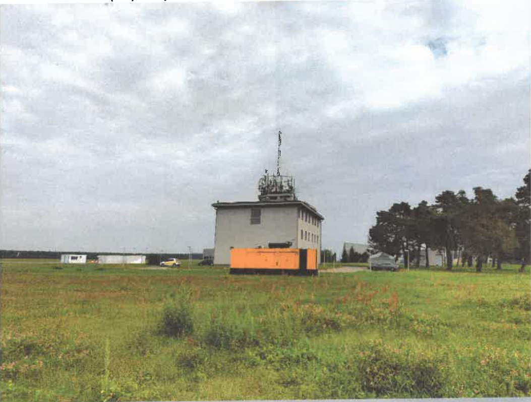
BUDYNEK NR 24 (SD) – wysokość 13,78 m