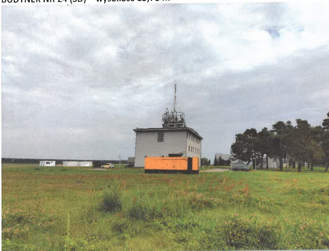
BUDYNEK NR 24 (SD) – wysokość 13,78 m